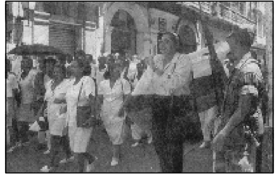
Protesta de Trabajadores de la Salud en Cartagena

En conclusión, los capitalistas y el imperialismo, no solo han suprimido la salud social a los trabajadores, sino que, el caos de su rebatiña y despilfarro del capital social destinado a la salud, pretenden resolverlo a cuenta del salario de las masas trabajadoras, y en particular, mediante el sacrificio de las reivindicaciones que aún mantienen los trabajadores de la salud.