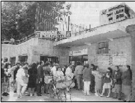
La espera interminable de los Usuarios