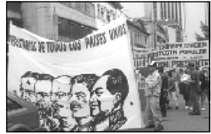
El Internacionalismo presente el 1o. de Mayo 1998 - Bogotá

Solo la movilización y la lucha nos garantizarán arrebatarle al estado mejores