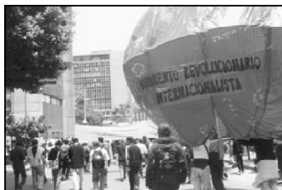
MRI presente el 1o. de Mayo 1998 - Bogotá

Este Primero de mayo debemos levantar en alto la bandera del internacionalismo proletario tomando como propia la lucha de nuestros hermanos que en países como Perú, Nepal y Filipinas libran una Guerra Popular dirigidos por auténticos partidos comunistas revolucionarios; haciendo nuestra la defensa de revolucionarios que como Mumia Abu Jamal en Estados Unidos está condenado a muerte y de Abimael Guzmán -el Presidente Gonzalo- quien en el Perú se encuentra confinado a aislamiento total con el grave riesgo de que sea asesinado.