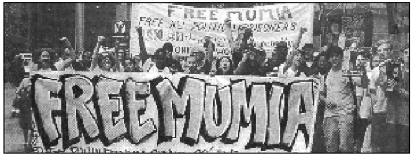
Manifestación de respaldo a Mumia, en Filadelfia EU.

¡Viva el Primero de Mayo Internacionalista y Revolucionario!