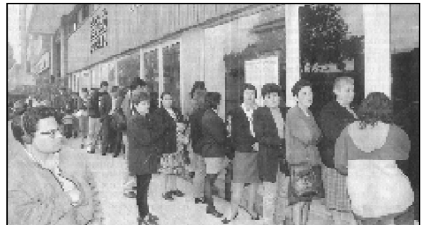
El viacrucis diario de los trabajadores en el ISS

En las propias clínicas y hospitales privados, sólo en los últimos meses se han cerrado 100 camas y 422 empleos permanentes (EL Espectador, 8 de marzo de 1999), tal como lo ilustra el caso del Hospital Infantil Lorencita Villegas, uno de los tres centros más grandes de pediatría en Bogotá, dotado de alta tecnología en especialidades como neurología, neuropediatría, oncología, infectología, ortopedia, urología, quemados, neumología, otorrinolaringología, endocrinología, dermatología, oftalmología, odontopediatría y medicina crítica. Fundado en 1941 como fundación privada sin ánimo de lucro , o sea como institución que subsidiaba la atención materno infantil a la población de escasos recursos, una de las responsabilidades del Estado más mentadas por los politiqueros de oficio. Hoy, cobijados por la Ley 100 considerada la «ley de la seguridad social» y debido a la ineptitud, despilfarro y parasitismo de la burocrática administración de los Santos del Tiempo, una rica y poderosa familia de la burguesía colombiana, se suprime la atención pública y se lanza a la calle a sus cerca de 1000 trabajadores a padecer hambre junto con sus familias.