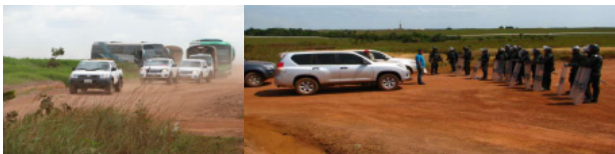
La represión es lo primero que el gobierno envía contra los trabajadores

Renovamos nuestra exigencia a la liberación inmediata de los 11 compañeros detenidos, y nuestro respaldo a la lucha de los trabajadores, a la huelga petrolera, a la unidad de ésta con las demás luchas del pueblo colombiano.