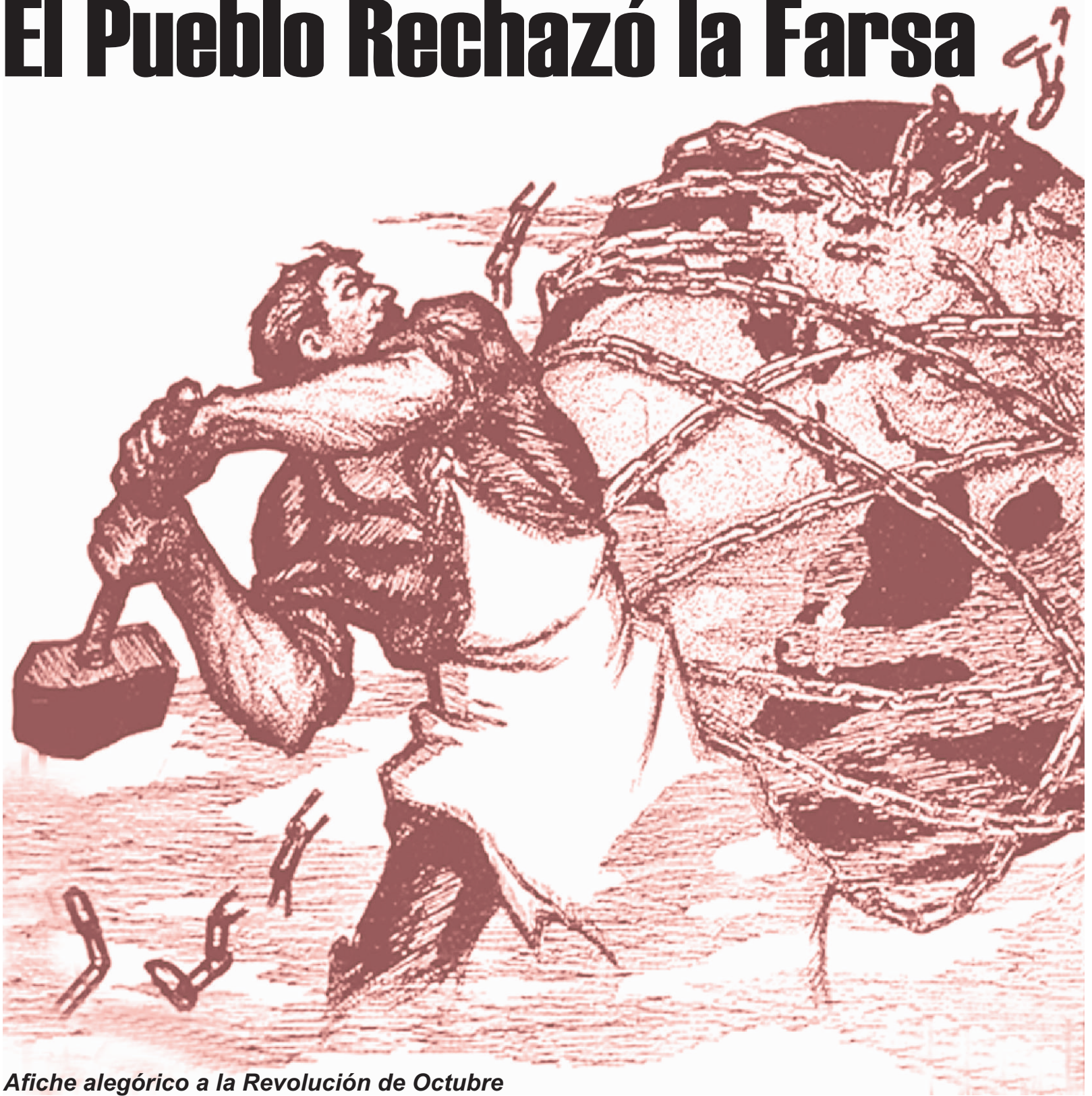
Afiche alegórico a la Revolución de Octubre

Abajo el Podrido Estado Burgués Viva el Futuro Estado de Obreros y Campesinos